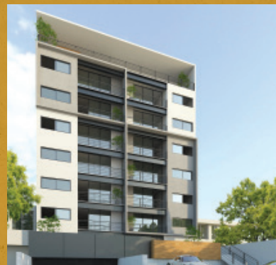
Rojas 117, Guadalajara