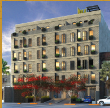
Coordinada Chapultepec, Gdl.