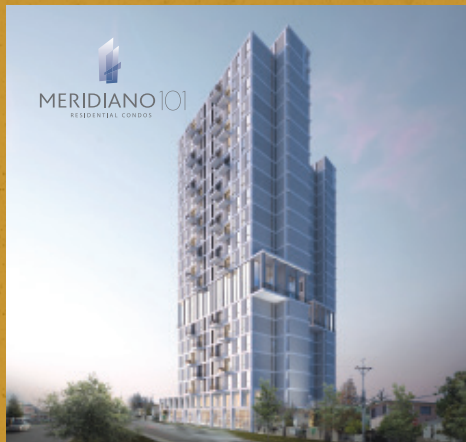
124 Departamentos, León, Gto.