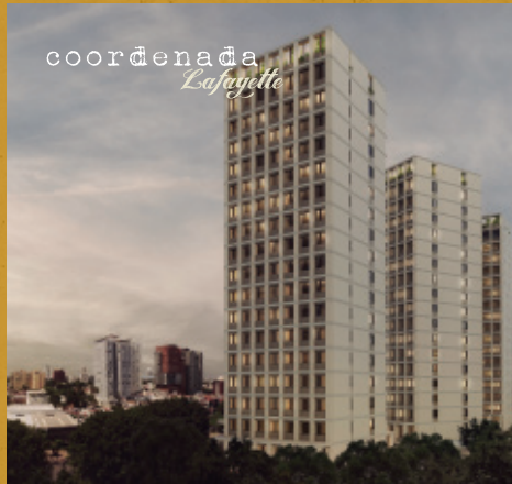
215 Departamentos, Guadalajara, Jal.