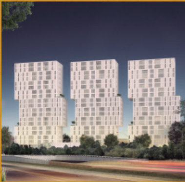
Meridiano 103, Zapopan

Somos una desarrolladora con 15 años de experiencia y una continua mejora en nuestros procesos y proyectos. Contamos con el respaldo y la experiencia de más de 30 desarrollos terminados y en proceso, con más de 2,000 unidades entregadas y en construcción, que avalan nuestro compromiso y capacidad de ofrecer rendimientos por encima del 20% en todos nuestros proyectos.