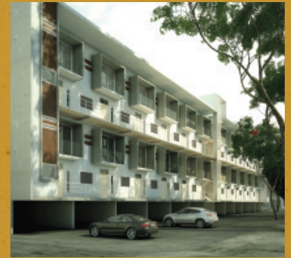
Lofts del Valle, Zapopan