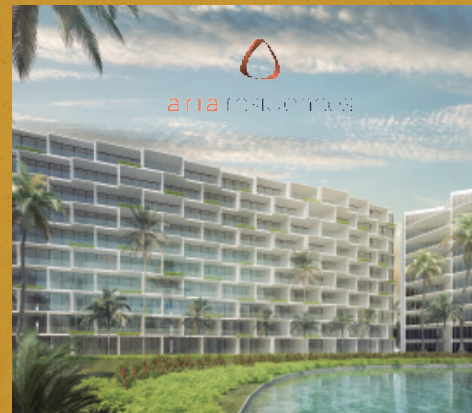
157 Departamentos, Nuevo Vallarta, Nay.