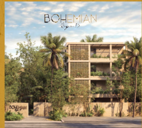
91 Departamentos, Tulum, Q. Roo