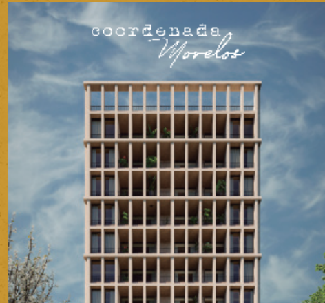
74 Departamentos, Guadalajara, Jal.