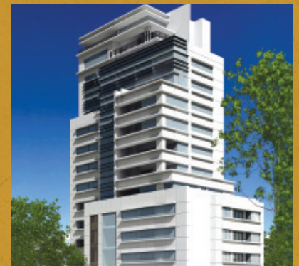
Torre Q, Guadalajara