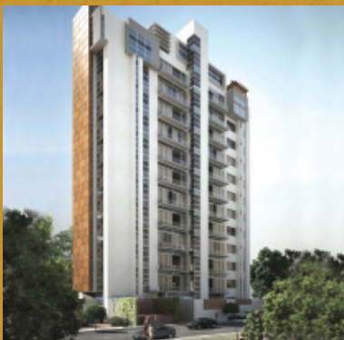
Q Country, Guadalajara