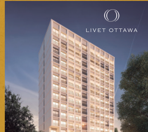
58 Departamentos, Guadalajara, Jal.